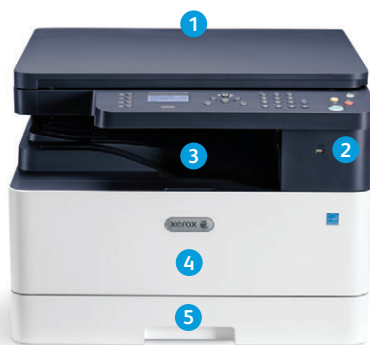
Urządzenie wielofunkcyjne Xerox® B1022

9 Urządzenie Xerox® B1025 jest wyposażone w większy, 4,3-calowy kolorowy interfejs ekranu dotykowego , dzięki któremu obsługa jest jeszcze prostsza.