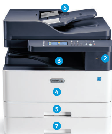
Urządzenie wielofunkcyjne Xerox® B1025

Pokazana konfiguracja podajnika DADF z opcjonalną tacą dodatkową.